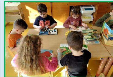
MŠ – Návštěva knihovnice