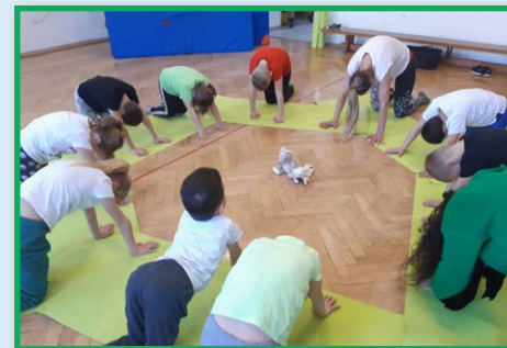
ZŠ a MŠ – Jóga pro prvňáčky a předškoláky

Vážení čtenáři, v tomto vydání Hlasatele vás obrazem informujeme o činnosti naší školy. Přejeme krásné jarní dny a dobrou náladu.