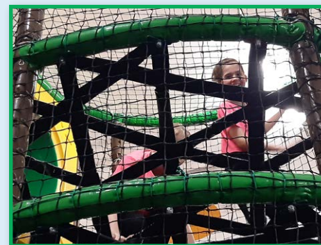
ZŠ – Sportovní dopoledne v Plzni - Area "D"