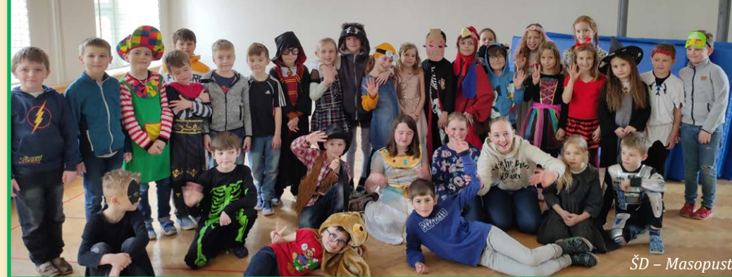
Zaměstnanci ZŠ a MŠ

Pročetl jsem několik vydání Hlasatele a v duchu vždy porovnávám situaci, která ohledně informací a reportáží o dění v DL panovala v první polovině šedesátých let a která panuje dnes. Velmi pozitivní dojem mám ze skutečně velkého množství různých popisovaných aktivit, především se mi líbí reportáže ohledně volnočasových akcí a kroužků pro děti. Je dobře, že se o tom tímto způsobem může dovědět i širší veřejnost. Hlasatel je z mého hlediska na celkově velmi vysoké úrovni. Příspěvky jsou dle informační hodnoty a významu řazeny logicky za sebou a pro člověka, který sice nebydlí v Dolní Lukavici jako já, ale občas ji navštěvuje a zajímá se jak o veřejný život, tak o různé významné detaily včetně aktualit, se jedná o nepostradatelnou pomůcku, která v kompaktní formě přináší nejen důležité informace, ale umožňuje také nahlédnout do historie obce. Jako překladatel si dovoluji poznamenat, že příspěvky jsou i jazykově na velmi dobré úrovni a přesto lehce srozumitelné snad pro každého čtenáře. Ať se časopis daří i nadále a ať ho čte více čtenářů v zahraničí jako já.