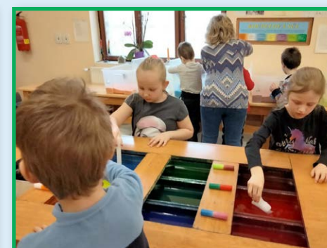
MŠ – Svíčkárna Litice