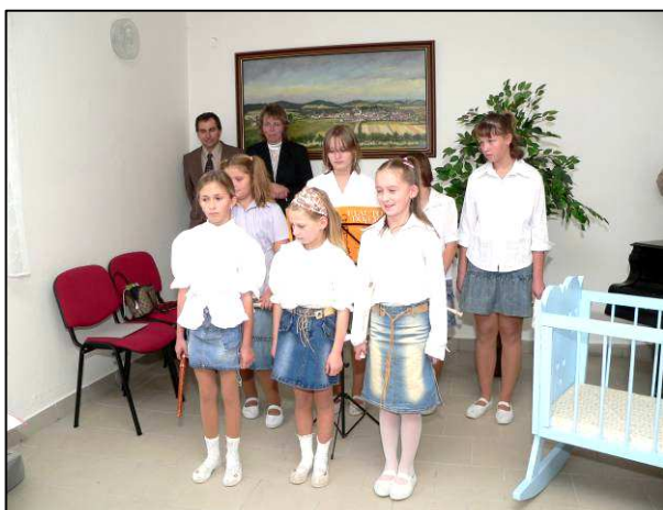
Vystoupení na vítání občánků v Dolní Lukavici

Vystoupení na setkání důchodců v H. Lukavici pením a zúčastnit se předvánočních trhů v německém Nittenau v neděli 9.prosince 2006, zájezd pořádá Mikroregion Přeštice. Můžete nás také vidět na některém z plesů v Dolní Lukavici a okolí, Mikulášské besídce ZŠ a MŠ Dolní Lukavice. Zveme Vás na tradiční vánoční zpívání v předvánoční době do kostela SV.Petra a Pavla v Dolní Lukavici, kde v letošním roce vystoupí naši hosté a v závěru školního roku na tradiční koncert u příležitosti Dne hudby, který pořádáme společně s kulturní komisí OÚ Dolní Lukavice. Vážení posluchači, těšíme se na Vás a přejeme Vám krásný a příjemný rok!