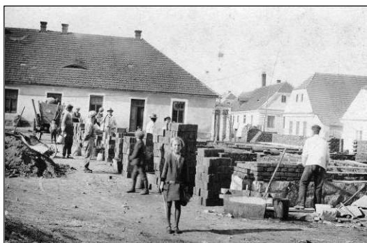
Výstavba Obecního úřadu Dolní Lukavice

Obecní úřad Dolní Lukavice má zájem o historické materiály. Žádáme občany o zapůjčení historických fotografií z dění v obci. Skenováním vytváříme archiv starých fotografií, abychom zabránili jejich zničení působením času a nepříznivých vlivů. Na webových stránkách najdete první vlašťovky této práce, historické pohlednice a fotografie Lukavicka z počátku 20.století.